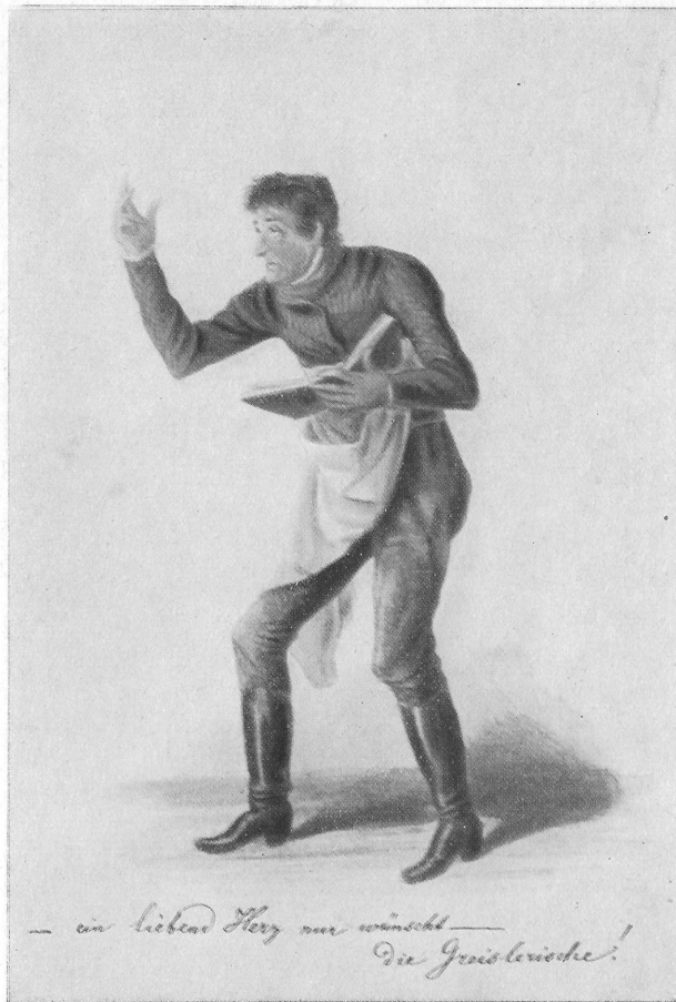
Nestroy als Knitsch nach einem Aquarell von Franz Gaul

Froberg. Oh, warten Sie nur, ich werde so lange fortfahren —